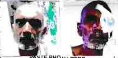
PASTE PHOTO HERE

FATHER'S/SPOUSE'S NAME : Bihari Lal पिता/कटुम्भ का नाम